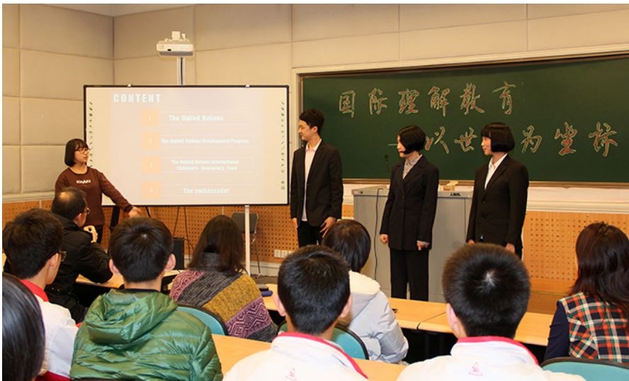
图 2. 东北育才学校开展“以世界为坐标”国际理解教育活动

主讲的同学带领大家共同认识和处理全球社会存在的重大共同问题，例如环境、恐怖主义、资源与能源问题等。同时，主讲的同学还将内容精心编排成短剧，给展示增添了趣味性。