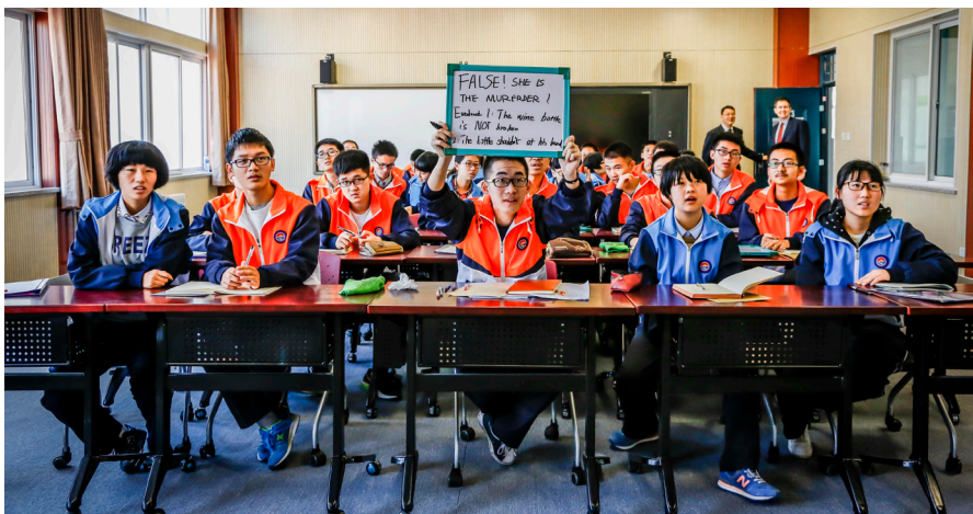
图 6. 延安中学学生在上卫星课

相关负责人介绍,相比互联网传输课程,卫星教室借助摄像头、电子大屏、卫星信号接收设备,可以实现外教课堂无卡顿传输,外教也可以与学生们实时互动,这对于帮助学生集中注意力、提升教学质量尤为重要。7年来,通过卫星教学的方式,北京王府学校、北京王府公益基金会联动,已为延安、井冈山、六盘水等革命老区的孩子们上课560个课时,累计2454名学生受益。