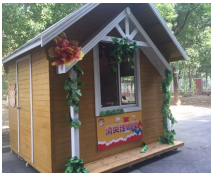
图 4. 常州市武进区清英外国语学校开设的“CK 小镇”

资料来源：中国教育新闻网·儿童“地球村的遇见”[EB/OL]. (2019-02-26)[2020-12-02]. http://www.jyb.cn/rmtzgjjsb/201902/t20190226_214437.html