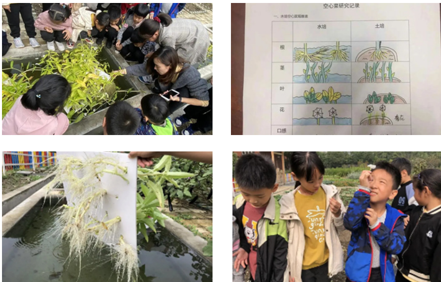
图 3. 武进清英外国语学校“可持续发展”动植物研究组探究空心菜的生长过程

清英外国语学校围绕联合国项目“170 项日常行动”之“可持续发展”，成立学生动植物研究组。孩子们通过观察空心菜种植过程，回答老师提出的问题，并在观察中学会了研究方法，体验了合作与分享，提升了科学素养，对联合国可持续发展目标有了更深入的了解。