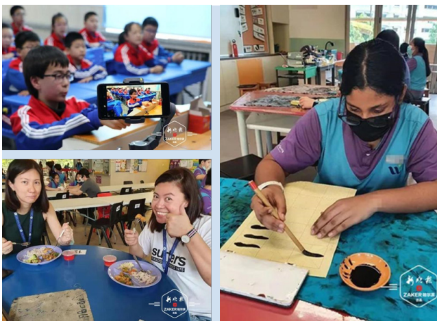
图 7. 经纬学子“云端”游学新加坡活动场景

哈尔滨市欧洲新城经纬小学学生通过屏幕，到新加坡小学“游”了一圈。在活动中，两校学生通过破冰游戏打破初次见面的陌生感，在盲画游戏过程中不仅加深了了解，更收获了快乐。学生们还分别介绍了各自城市及国家，帮助彼此对各自生活环境有了更加直观地了解。学生通过用对方母语介绍交流的方式，向彼此呈现了具有国际视野和语言交流技能的国际公民形象。伟源小学的老师为经纬小学的学生们上了一节马来西亚传统文化 Batik 蜡染画，经纬小学赵娜老师为伟源小学的学生们教授了一节书法课。两校学生在相互实践各自传统文化过程中，感受着两国传统文化的魅力，也加深了对彼此文化的理解。